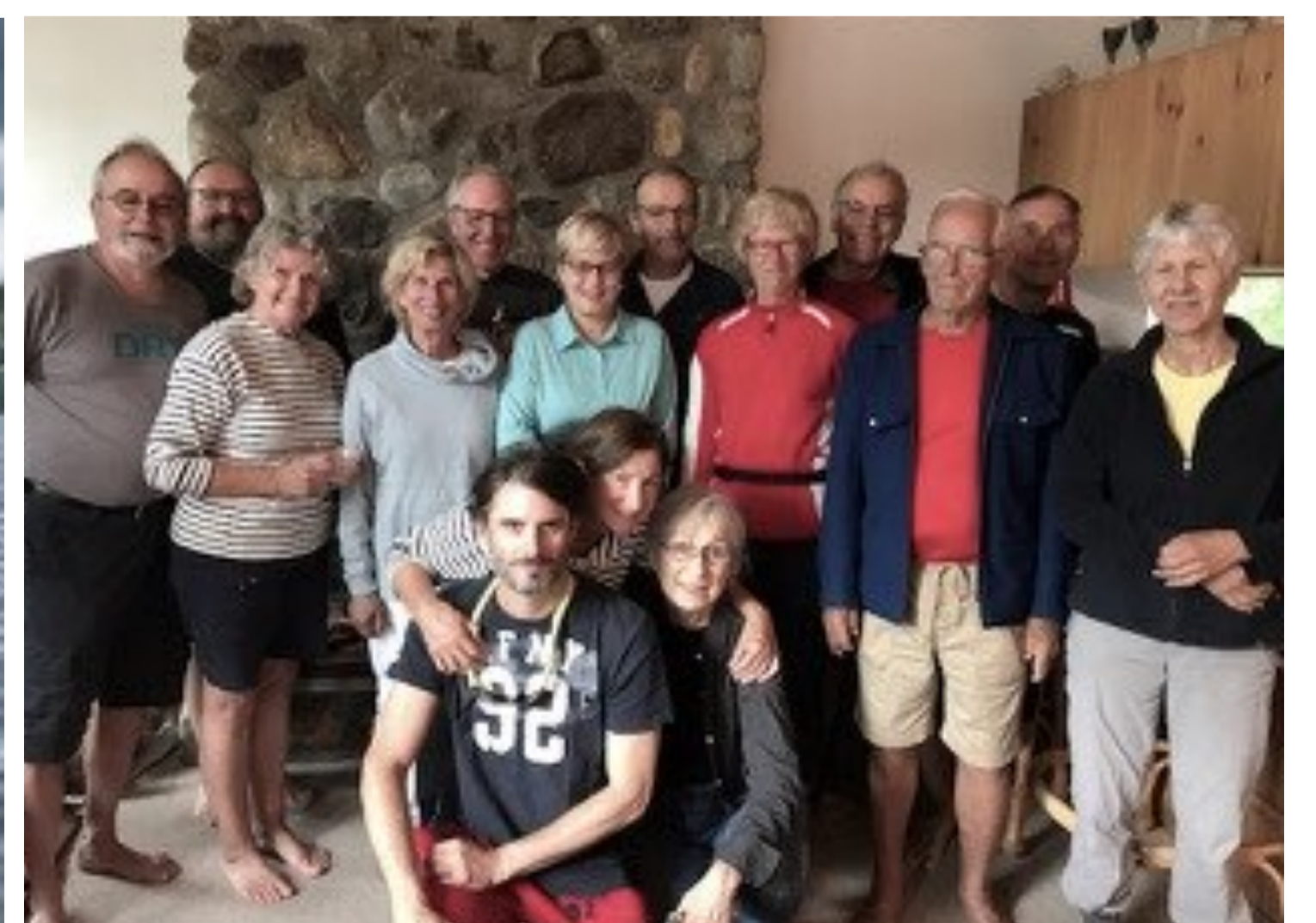
Membres ayant participé à l'échantillonnage des plantes aquatiques le 10 août.