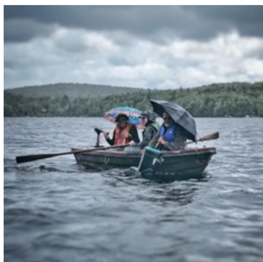
Membres participants à l'activité du 10 août