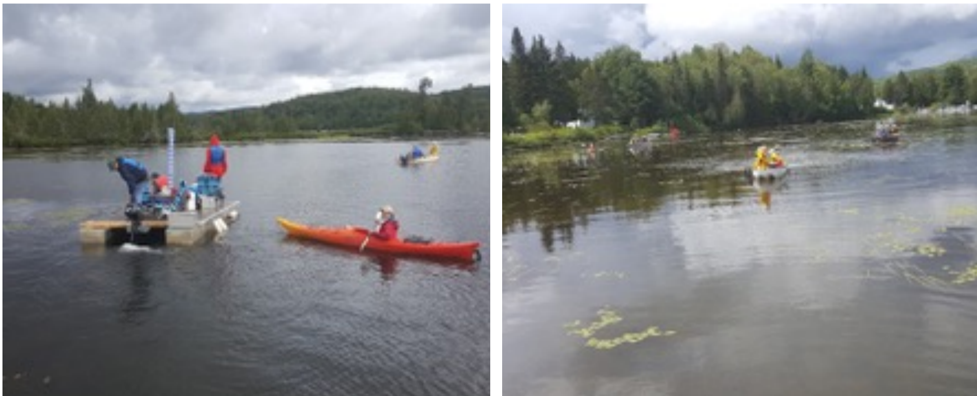
Échantillonnage des plantes aquatiques

Le relevé des plantes aquatiques s'est fait le 10 août dernier et a nécessité l'aide de 16 membres, un ponton, un radeau, 4 chaloupes et un kayak. Des râteaux, aquascopes, fiches d'identification et bacs ont été utiles à réaliser l'échantillonnage des plantes aquatiques.